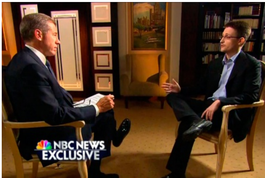
Snowden, en entrevista con Brian Williams para la NBC.

“Declarar la inconstitucionalidad de esta normativa es un gran avance, sobre todo porque esta norma se dio en el 2006 y luego de las revelaciones de Snowden fueron adelante (con su cancelación)”, afirmó Rodríguez.